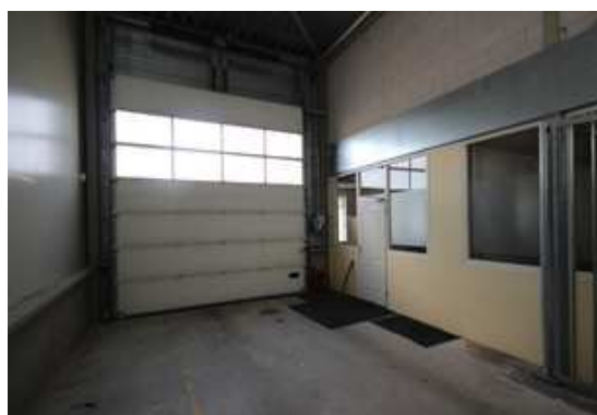
Gaffel 22 Zeewolde