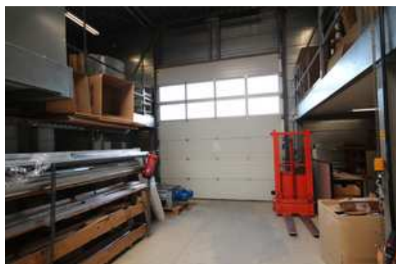
Gaffel 24 Zeewolde