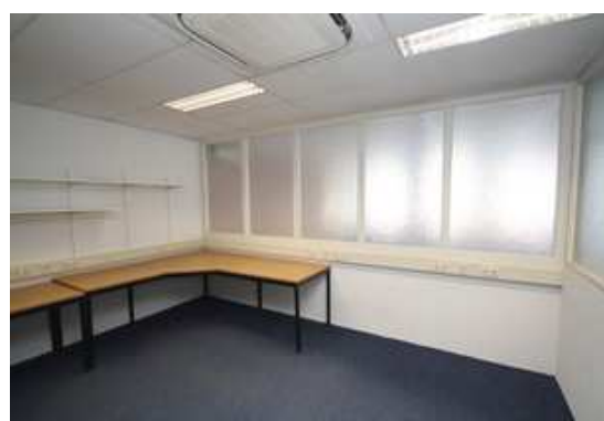
Gaffel 22 Zeewolde